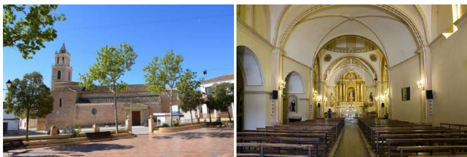
Iglesia de la Purísima Concepción de Barrax.

La dependencia de la iglesia de Barrax de la matriz de Lezuza, como es natural, no satisfacía a los vecinos de aquélla, y en el año 1774, el concejo de Barrax otorga un poder a Alonso Rodríguez de Bobada para iniciar los trámites de la segregación. Envían un primer escrito al arzobispado de Toledo en el que argumentan diversas razones para ello: que ambas villas distan entre sí tres leguas “ de camino muy áspero y fragoso y de frecuentes y abundantes nieves y lluvias ”; que el teniente de cura que regentaba la parroquial de Barrax no era “ persona de carrera que tenga la instrucción necesaria para ejercer la cura de almas ”; y por supuesto también aluden “ a la extrema necesidad que padece la iglesia en reparos, ornamentos, alhajas y demás adornos, (...) está caída por el coro, (...) el órgano está inservible y la torre sin campanas de provecho, pues una que había buena se ha quebrado ” (Jaén, 2011, pp. 50-51). Terminan pidiendo que sea iglesia independiente y que se ponga un cura propio.