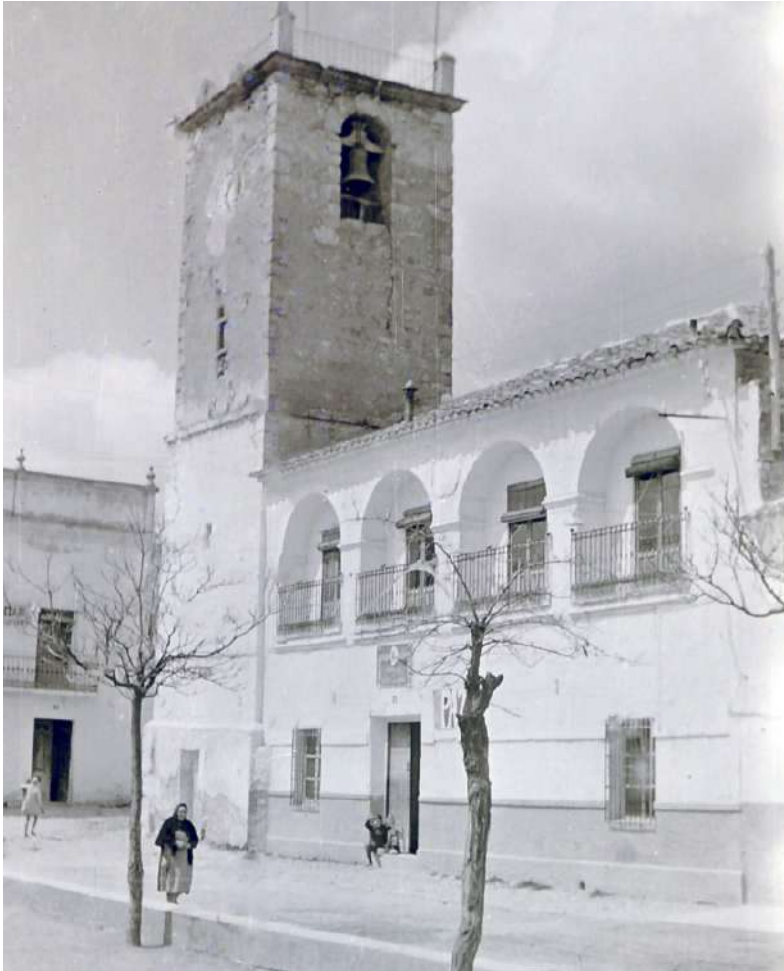
Antigua Torre del Reloj y Ayuntamiento de Lezuza. (Foto: A. Martínez Moreno, hacia 1965)

Antes del último pago, hubo de ser aprobada la obra por maestro inteligente en la materia. Y para este caso, el arzobispado de Toledo envió al organero de la catedral, Luis Berrojo 22 , “para la aprobación del órgano nuevo que se a echo” 23 . El informe fue favorable y se le abonaron al toledano 1.362 reales, por su desplazamiento y “por el gasto de comida y cevada” , claro está, ¡para las caballerías!