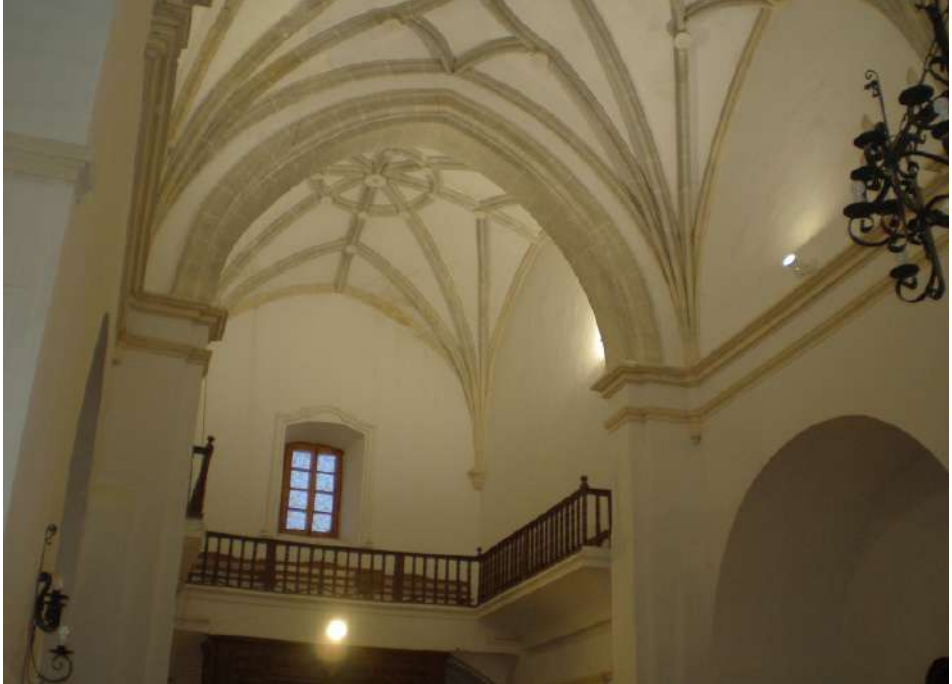
Coro de la iglesia de Lezuza, lugar donde estuvieron situados los órganos construidos por Francisco Gómez El Viejo (1581), por Francisco Buchosa (1746) y Gaspar de la Redonda (1773).

la Real Chancillería de Granada por incumplimiento de contrato (Santamaría, 1988, p.14). Y el cura, tras seis años de espera, solicita que la obra se ejecute con toda brevedad. Este largo pleito, según Enrique Máximo, ocasionaría la ruina económica del organero 16 .