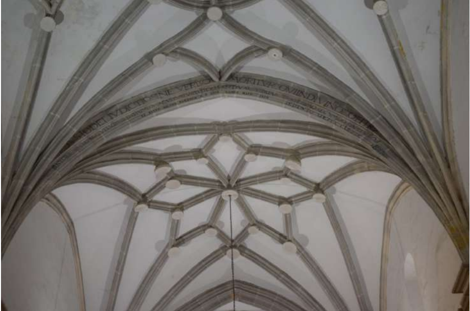
Arco perpiño y bóvedas de crucería góticas de la iglesia de Lezuza. Inscripciones referentes al capítulo trigésimo segundo de Isafas. También aparece otra que dice: "SE PINTO QESTA CLESIE 1804".

en todo su esplendor, con habilidad y destreza, consiguiendo que la trompeta magna, los nasardos y las quincenas inundasen de poesía y espiritualidad el templo parroquial.