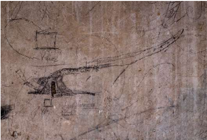
Grafitis en el cuarto de los fuelles del órgano, realizados durante la Guerra Civil. Arriba, una vertedera, y abajo, un arado. Año 1938.