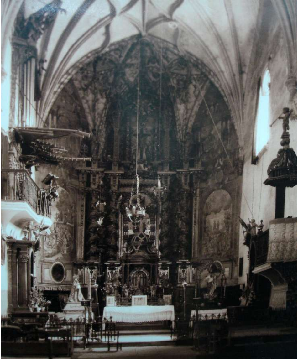
Presbiterio de la iglesia de Ntra. Sra. de la Asunción de Lezuza. A la izquierda, en el lado del evangelio, el órgano de Gaspar de la Redonda.

Hasta aquí, un resumen de lo publicado en la revista Albasit . Nuevos descubrimientos y hallazgos nos hacen abordar esta nueva publicación en torno a los órganos que tuvo la iglesia de Lezuza.